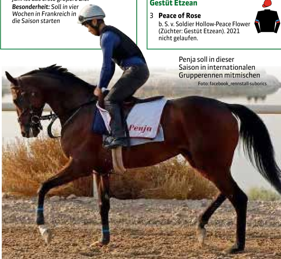
Penja soll in dieser Saison in internationalen Grupperennen mitmischen