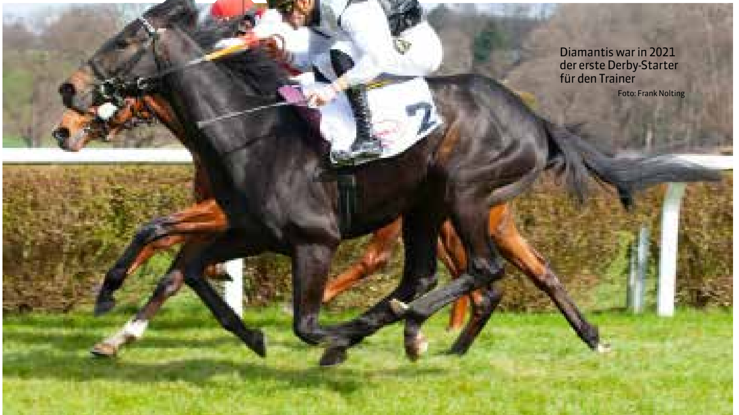
Diamantis war in 2021 der erste Derby-Starter für den Trainer

Perspektive: Erst Handicaps, später will man Black Type erzielen