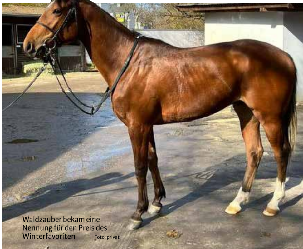
Waldzauber bekam eine Nennung für den Preis des Winterfavoriten