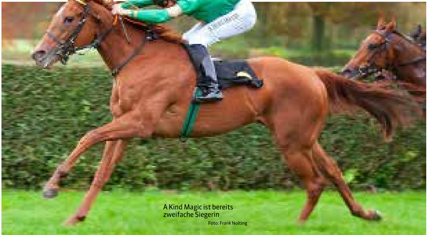
A Kind Magic ist bereits zweifache Siegerin

Besonderheiten: Gewann im vergangenen Jahr in ganz leichter Manier das Kölner Union-Rennen und galt danach als Derby-Favorit, musste Hamburg aufgrund einer Verletzung aber auslassen und war seitdem auch nicht mehr am Start, über den Winter hat er sich prima weiterentwickelt, die Verletzung ist auch komplett ausgestanden, Trainer hat viel Mumm für diese Saison, als erstes größeres