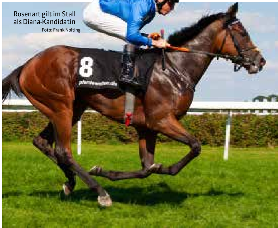
Rosenart gilt im Stall als Diana-Kandidatin