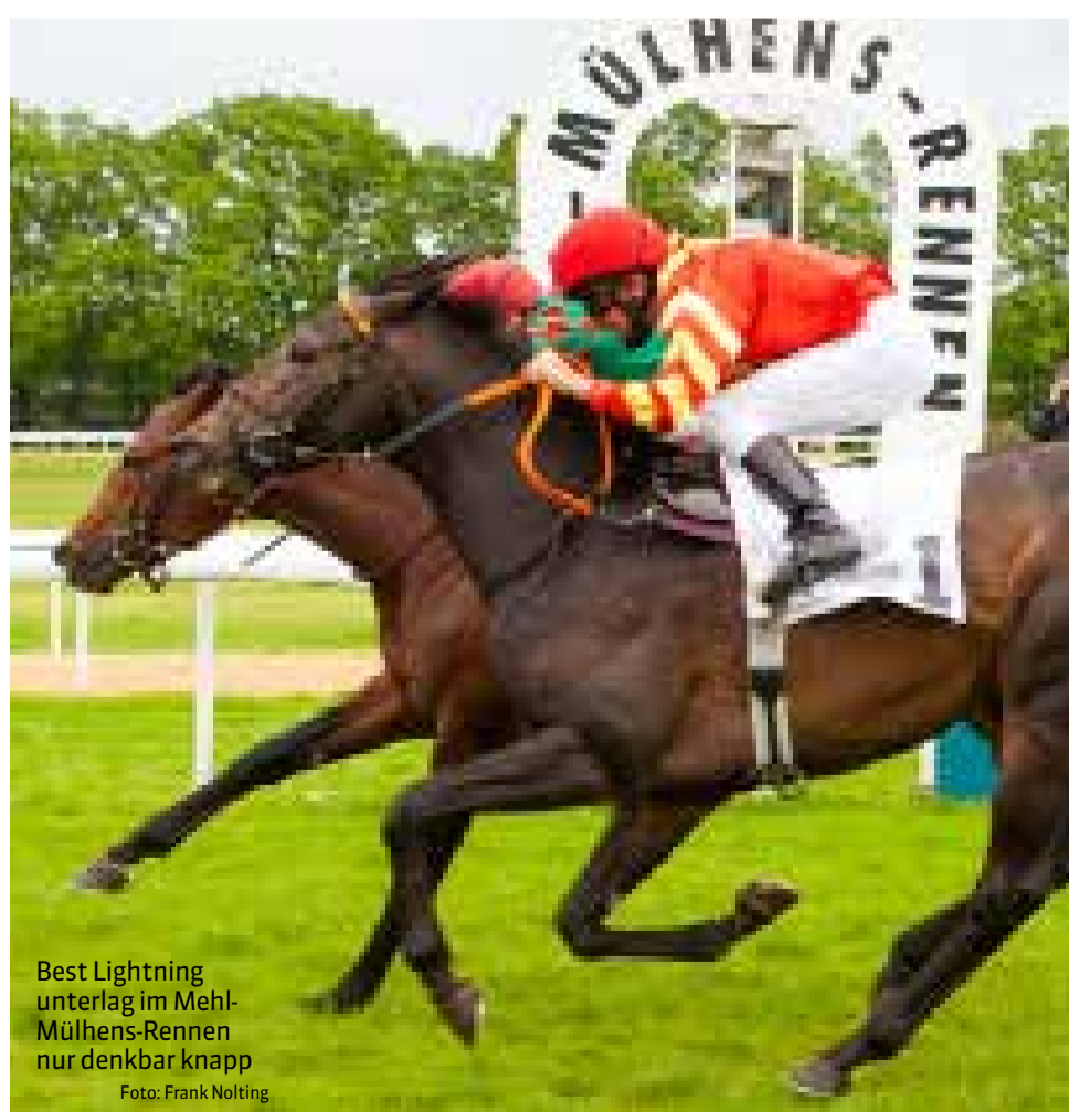
Best Lightning unterlag im Mehl-Mülhens-Rennen nur denkbar knapp

3 H Near Emperor 3 S Rosenart 2 S Sweet Hole