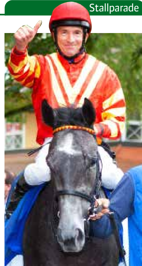
Best Flying hat zweijährig bereits über 100.000 Euro verdient

Hat sich über den Winter schön gemacht, könnte im Herbst seinen Einstand geben