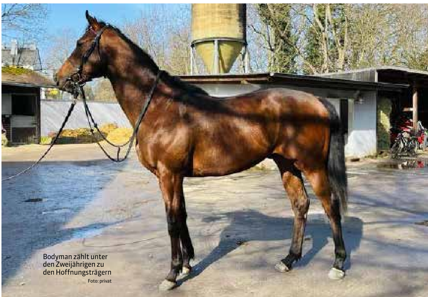
Bodyman zählt unter den Zweijährigen zu den Hoffnungsträgern