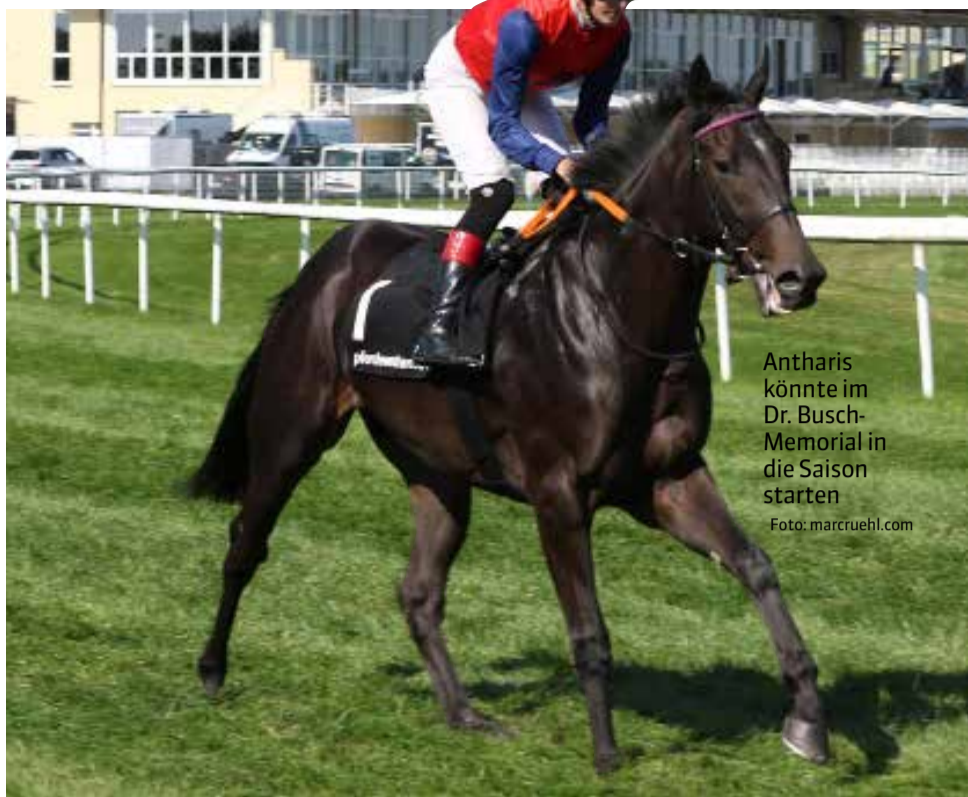
Antharis könnte im Dr. Busch-Memorial in die Saison starten