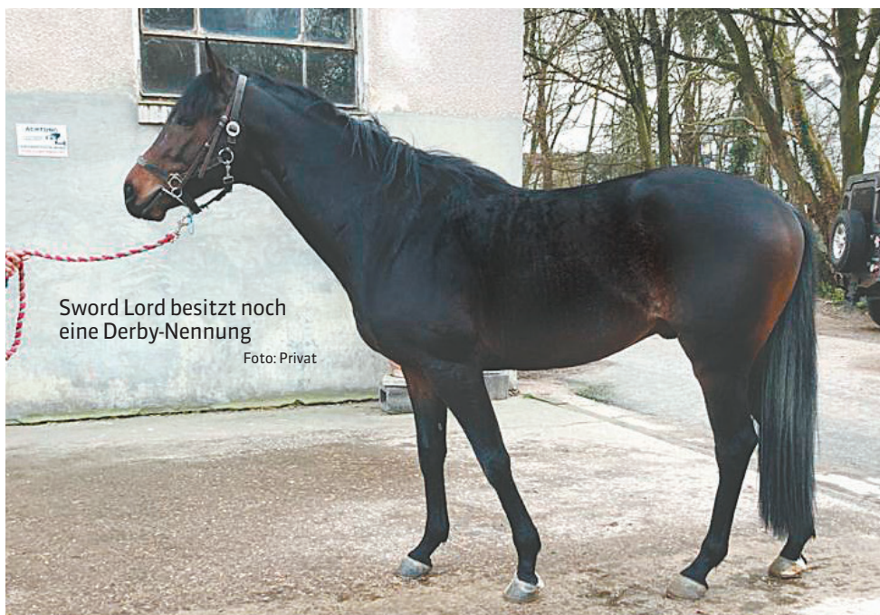
Sword Lord besitzt noch eine Derby-Nennung

Perspektive: Soll wieder viel Freude machen, kann sich als Wallach noch weiter verbessern