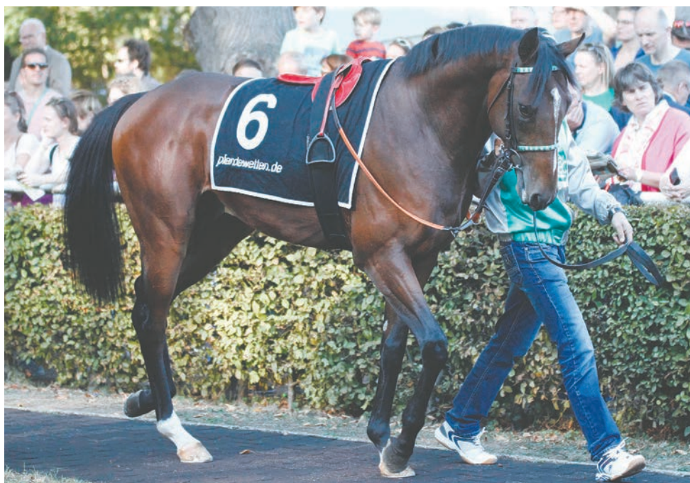
Rip Van Lips soll in besseren Aufgaben zum Einsatz kommen