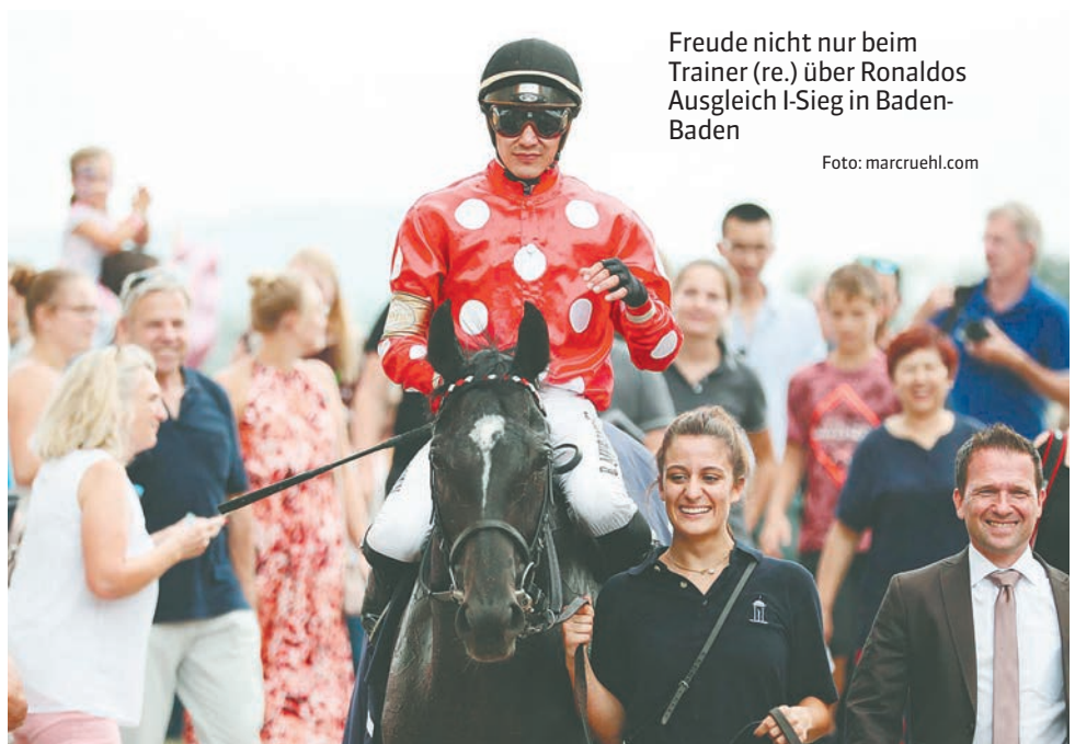
Freude nicht nur beim Trainer (re.) über Ronaldos Ausgleich I-Sieg in Baden-Baden