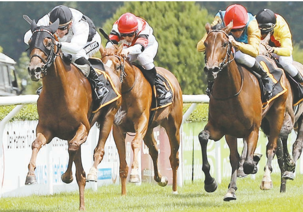
Ancona (li.) - hier bei ihrem Maidensieg in Düsseldorf - kann schon Black Type vorweisen