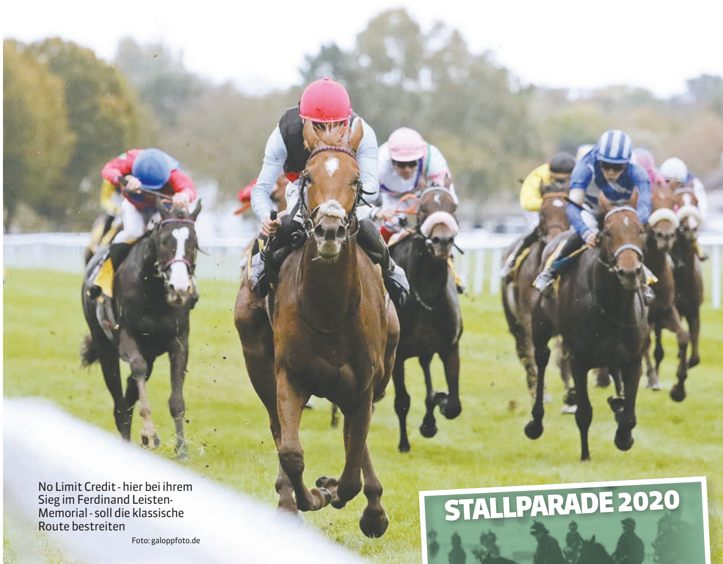
No Limit Credit - hier bei ihrem Sieg im Ferdinand Leisten-Memorial - soll die klassische Route bestreiten